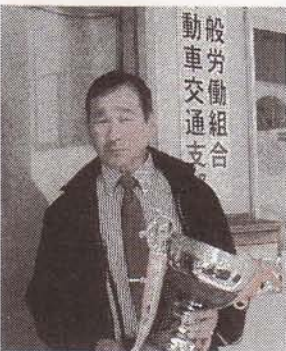
一般労働組合 自動車交通支